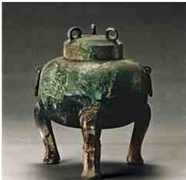
«Дин». Китай. 1320 г. до н.э.

«Дин» изначально — это огромный горшок с тремя ножками, который использовали в ритуалах или как символ власти. Изначально на треножниках гравировали лишь имя владельца. Но со временем на бронзе стали оставлять и более длинные надписи о том, для чего и когда был отлит треножник.